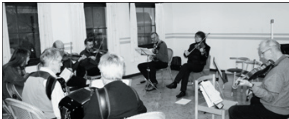
Här är kursen i full gång.

Kursdeltagarna for hemåt i höstmörkret men verkade rätt nöjda. Vi pratade om en återträff fram på vårkanten men inget datum fastställdes.