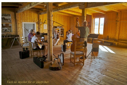
Tack så mycket för er gästfrihet.