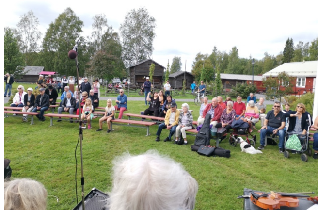
Publiken njöt i det fina vädret