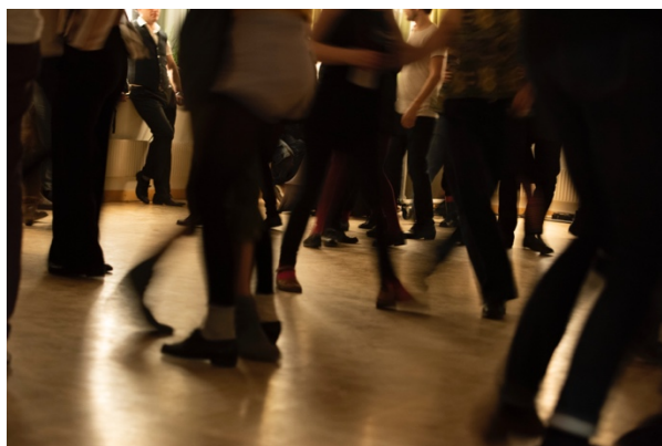
Trångt, trivsamt och varmt på dansgolvet