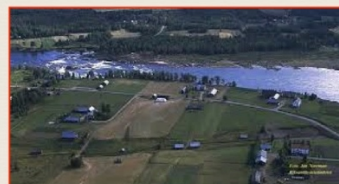
Matkakoski Färdforsen i bakgrunden.