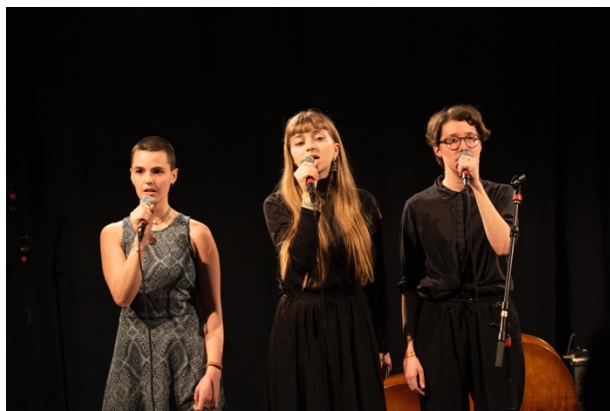
Framnäs Folkhögskolas stoltheter Spektakel var naturligtvis där.