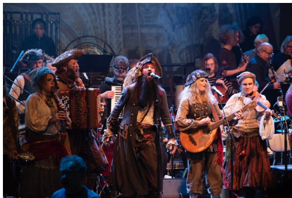
Ye Bannished Privateers

Umefolk som traditionsenligt går av stapeln i februari bjöd på en kavalkad av olika musikstilar, mängder med buskspel, stora och små konserter, barnteater, dans, workshops, koreograferade tramporglar, vilda pirater, halsbrytande akrobatik och naturligtvis gemytligt umgänge med likasinnade från när och fjärran.