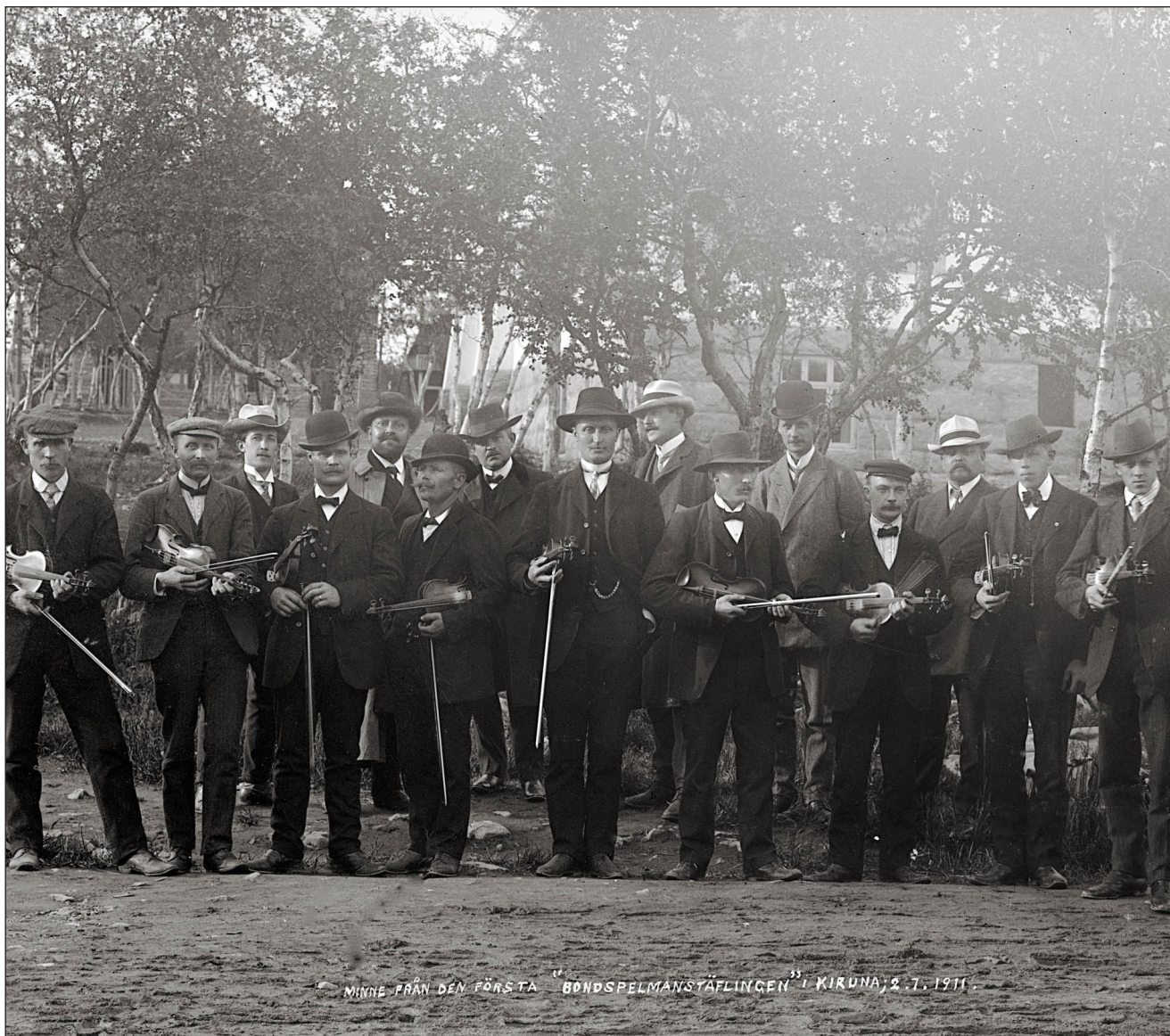
MINNE FRÅN DEN FÖRSTA "BONDSPELMANSTÄFLINGEN" I KIRUNA, 2. 7. 1911