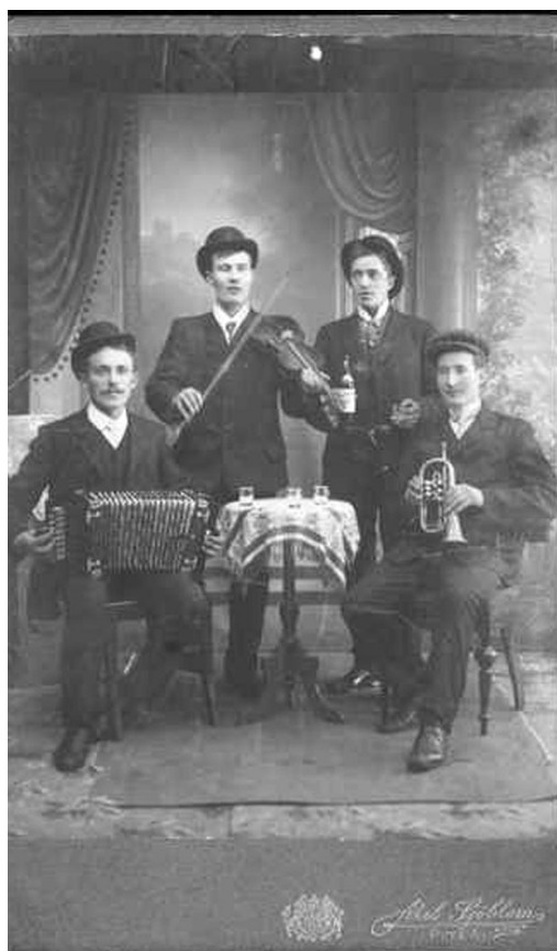
Känner ni igen någon på bilderna så hör av er!