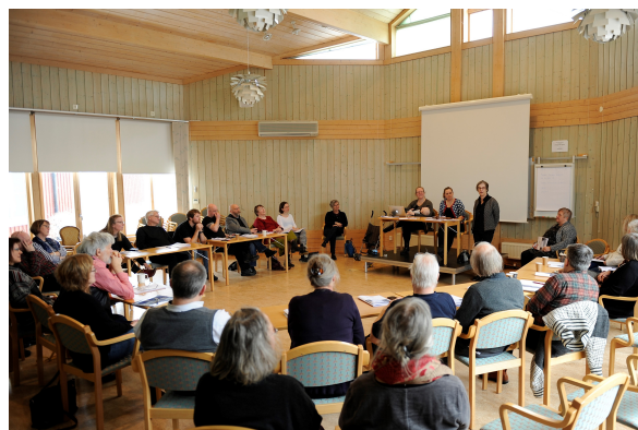
Förbundsstämman 2017 i Stiftsgårdens vackra möteslokal.

Söndagen ägnades åt själva årsstämman där mycket naturligtvis bestod av ren formalia men även här bjöds det upp till diskussion om arbetsätt och hur vi ska förnygra förbunds rörelsen.