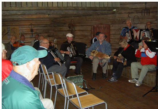
Allspel i Swensbylijda 2011.

Därefter finns möjlighet till samspel i mindre grupper i övriga utrymmen. Det större rummet på andra våningen rekommenderas gärna för stråkinstrument.